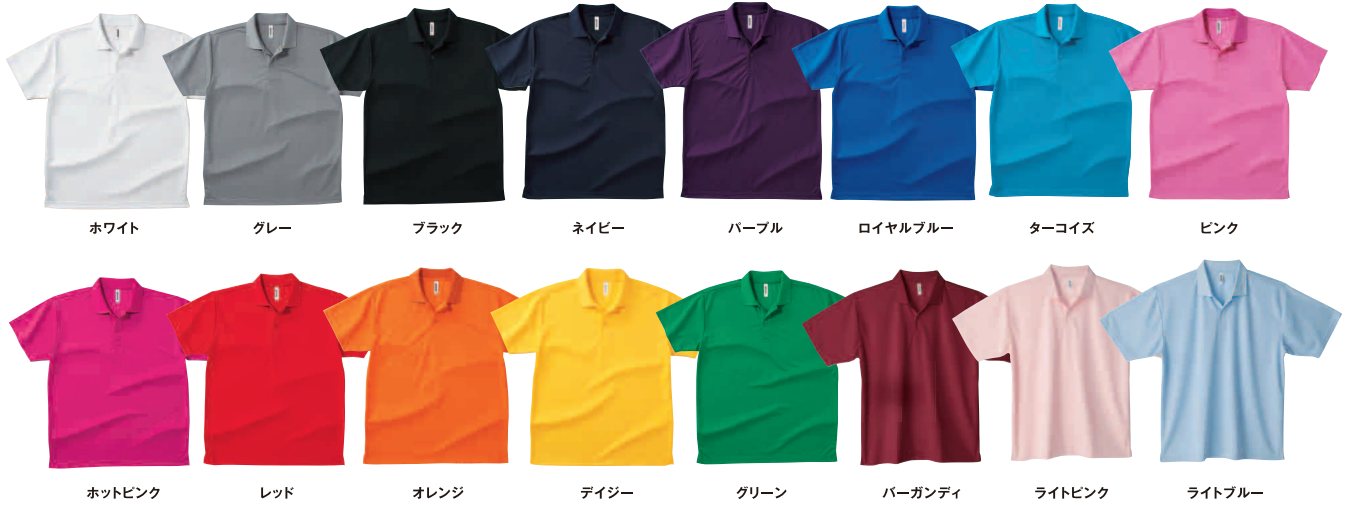
ホワイト グレー ブラック ネイビー パープル ロイヤルブルー ターコイズ ピンク ホットピンク レッド オレンジ デイジー グリーン バーガンディ ライトピンク ライトブルー

ギガラックス100H Tシャツ/ポロシャツは生産終了させていただきました。 追加注文の際にはドライTシャツ/ポロシャツを代替商品とさせていただきます。