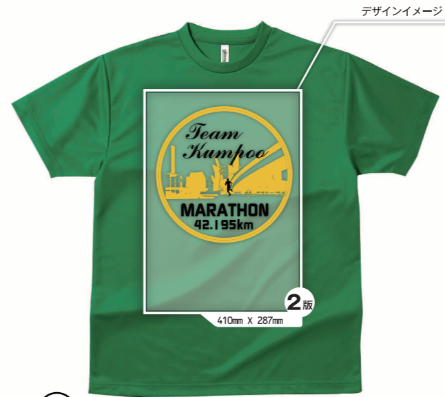
合計 2版 前面 2色 2版 のデザインの場合 ▲ウェアカラー：グリーン