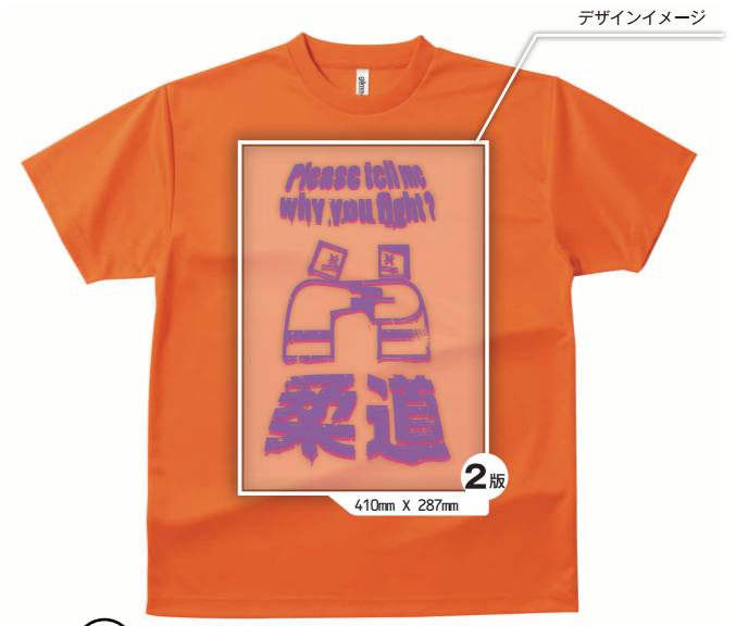
合計 2版 前面 2色 2版 のデザインの場合 ▲ウェアカラー：オレンジ