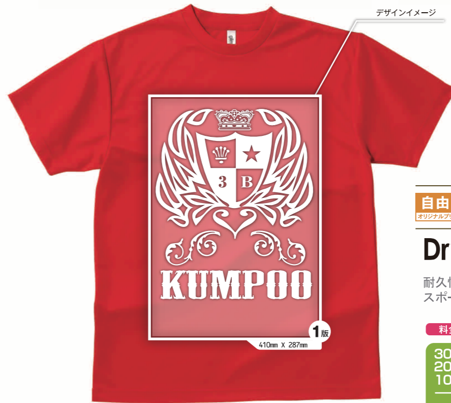
合計 1版 前面 1色 1版 のデザインの場合 ▲ウェアカラー：レッド

ギガラックス100H Tシャツ/ポロシャツは生産終了させていただきました。追加注文の際にはドライ Tシャツ/ポロシャツを代替商品とさせていただきます。